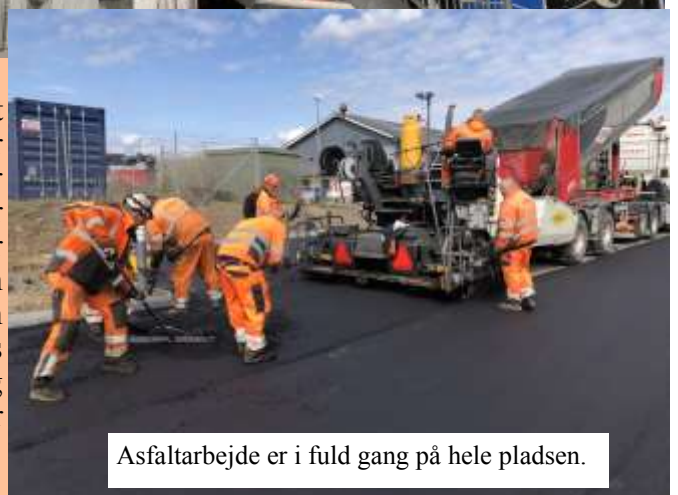
Asfaltarbejde er i fuld gang på hele pladsen.

Billedet ovenover illustrerer forsiden af et 4-sidet prospekt der sendes til alle de der ikke har fjernvarme i Egtved By. Sagen er at de der har NATURGAS ikke kan anvende dette brændsel efter 2030. Vi vil gerne levere disse kunder FJERNVARME. I første omgang er det en stillingtagen der skal foretages for husejeren som det er for Egtved Varmeværk. Kan der skaffes positiv tilslutning i et område for tilstrækkelig mange tilslutninger (70-80 %) etableres der fjernvarme.