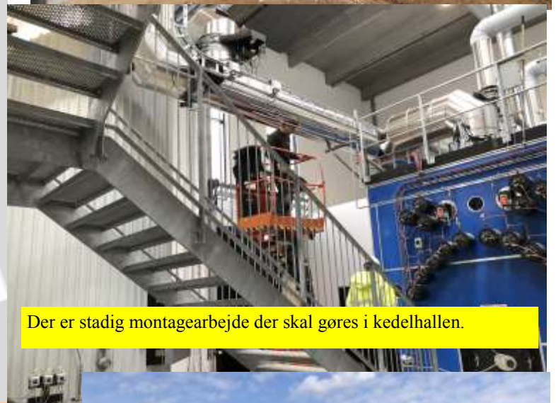
Der er stadig montagearbejde der skal gøres i kedelhallen.